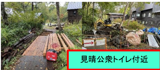
見晴公衆トイレ付近