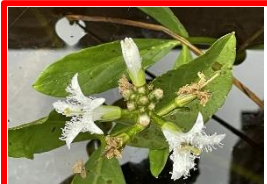
季節外れのミツガシワ