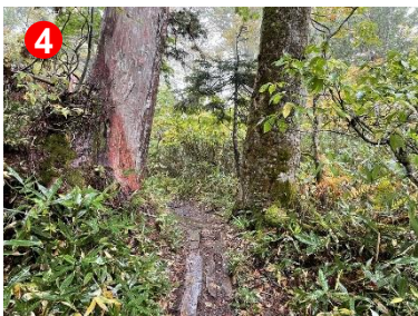
④ 滝道へのウェルカムゲート(二つの巨木が門のような)この先から木道が無くなり古道です。