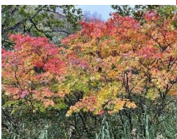
尾瀬橋付近のモミジ