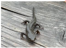
艶々のアカハライモリ