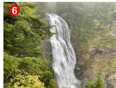
⑥ 水量が多く迫力がありました。紅葉の見ごろはもう少しです。