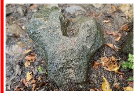
三条ノ滝へのルートにあったハート形の石