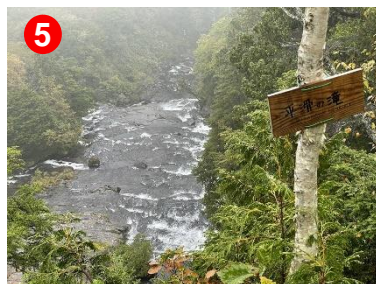
⑤ 平滑ノ滝は、昨夜からの雨で川幅いっぱい水量でした。