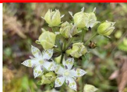
アケボノソウの花と実