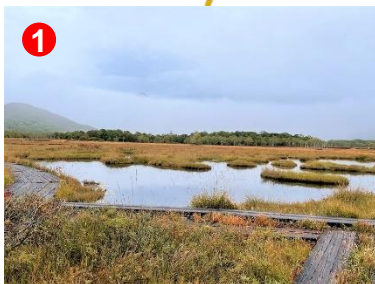
① 逆さ燧ビュースポットでは池塘に草紅葉の浮島が映えます。