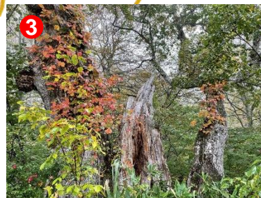
③ 温泉小屋手前のミズナラ巨木にはツタウルシが色付いています。