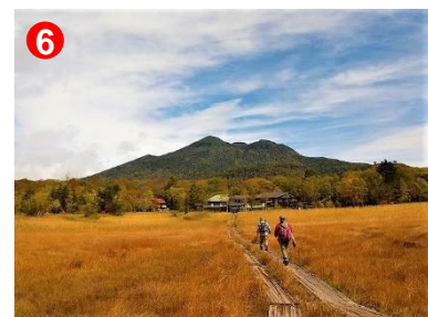
6 燧ヶ岳と草紅葉。まだ、深緑色の燧ヶ岳とのコントラストが美しいです。

【今日の尾瀬ヶ原】 天気：曇り時々晴れ 最高気温：—℃ 最低気温：—℃ 日の出：5時40分 日の入：17時20分