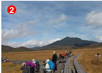
2 牛首では、紅葉を楽しみに来たハイカーで賑わっていました。