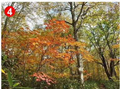
4 東電小屋付近の林内から東電尾瀬橋にかけて、紅葉が見事でした。