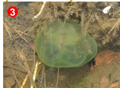
3 カンテンコケムシ。約1800ある尾瀬の池塘の中で、この辺りの池塘だけで見かけます。