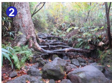
2 広沢田代までは木の根が張り出したり、大きな岩が多い登山道が続きます。