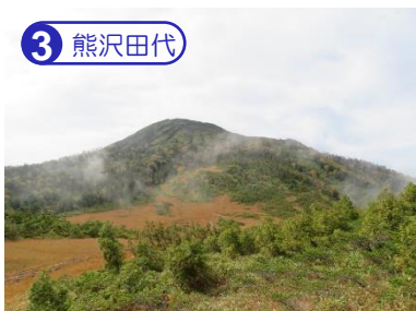
3 一旦熊沢田代まで木道を少し下ります。広いテラスでゆっくりと休憩を取りましょう。