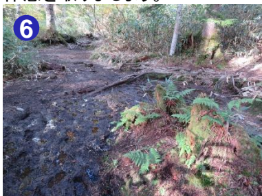
6 長英新道の下部は緩やかな登山道が続きますが、何か所かめかるみがあります。