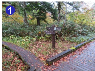
1 御池駐車場の奥に御池登山道への入口があり左に折れます。まっすぐ進むと御池田代です。

燧ヶ岳は6日に初冠雪となり薄らと雪化粧しました。尾瀬沼の最高気温も10度代前後です。防寒対策をしっかりとし登山をお楽しみください。