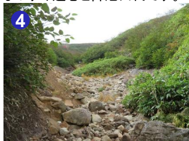
4 8月上旬まで雪が残るガレ場、ゴロゴロとした石が露出しています。登頂までもう一息です。