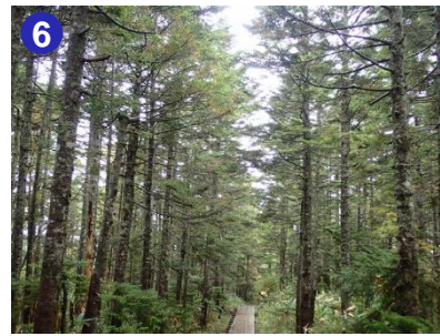
6 沼山峠付近のオオシラビソの樹林帯です。気持ち良い木道が続きます。