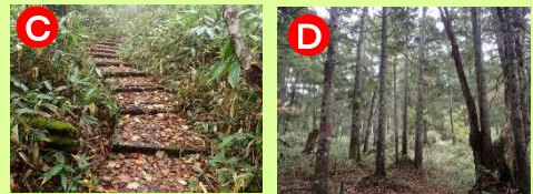
C 濡れた木道がとても滑りやすいです D 尾瀬沼キャンプ場上部の針葉樹林帯が爽快です