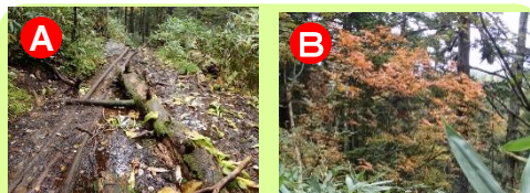
A ぬかるみや濡れた木道に注意しましょう B 高度を上げるにつれ樹木の紅葉が目立ちます