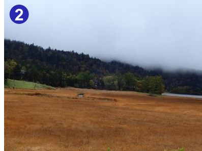
2 ヤナギランの丘より、大江湿原の草紅葉を俯瞰します。