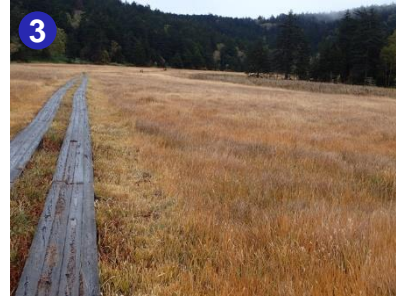
3 小淵沢田代分岐付近から沼山峠方面を撮影しました。一面草紅葉です。