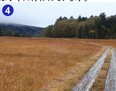
4 沼山峠の下りから大江湿原が開ける付近の様子です。草紅葉が眼前に広がります。