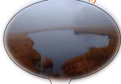
小淵沢田代(霧の中)