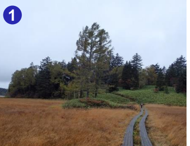
1 三本カラマツ付近の草紅葉の色も濃くなりました。木道脇の刈り払いは丁寧に行われています。