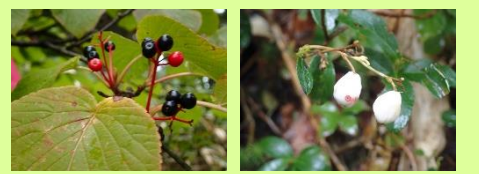
オオカメノキの実