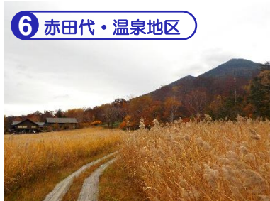
⑥ 赤田代・温泉地区