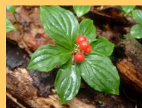
【ゴゼンタチバナ(実)】