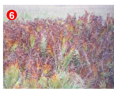
6 ヤマドリゼンマイが色づき始めました。