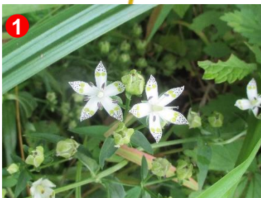
1 アケボノソウが咲いています。