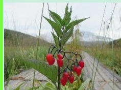
オオマルバナホロシの実