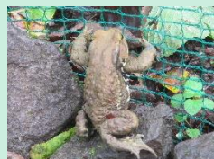
アズマヒキガエル