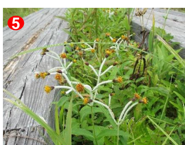
5 チョウジギクが木道沿いに咲いています。