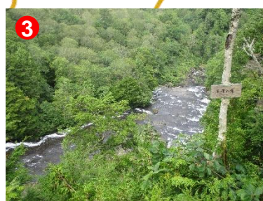
3 水量も多く迫力満点な平滑ノ滝でした。