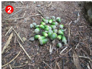
2 ドングリ（ミズナラ）がたくさん落ちていました。