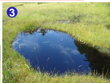
3 池塘を覗きこむと秋の青空が鮮やかに反射していました。