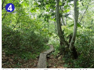
4 燧裏林道では長い森歩きが続きます。木道で足を滑らせないようにお気をつけください。