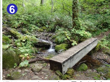
6 沢沿いでは、日本で最も小さな鳥の一種であるミソサザイが飛び回っていました。