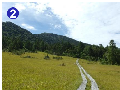
2 上田代では緩やかに傾斜した広い湿原をお楽しみいただけます。