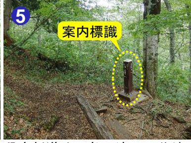
5 段吉新道や三条の滝への分岐では案内や地図をよく確認して、行動しましょう。