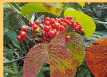
【オオカメノキの実】