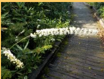
【サラシナショウマ】