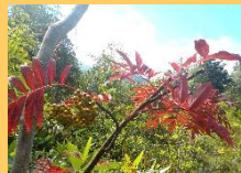
【ナナカマドの紅葉】