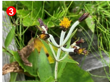
湿原に進出する沢の植物である チョウジギク