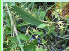
シロバナカモメヅル