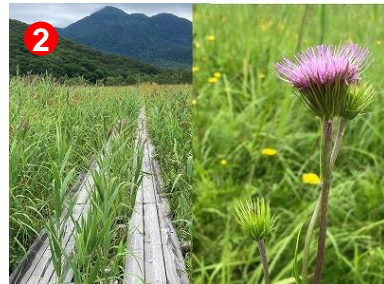
水位の高いヨシッポリ田代には低層 湿原特有のヨシとオゼヌマアザミ