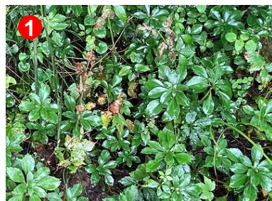
景鶴山麓から連続し下ノ大堀川 抛水林にも分布するフッキソウ