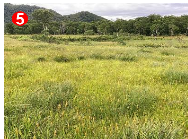
湿原に取り残された河川蛇行跡 の崖のような斜面