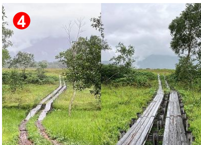
六兵衛堀を境にした湿原の高 まり (ブランケット泥炭地)