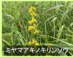
ミヤマアキノキリンソウ