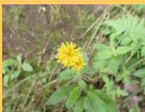
【ミヤマコウゾリナ】