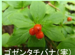
ゴゼンタチバナ(実)