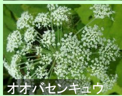
オオバセンキュウ