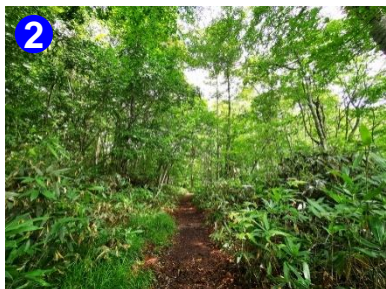
2 旧道はブナやミズナラの木が多く、また、横を流れる川のせせらぎを聞きながら歩けます。