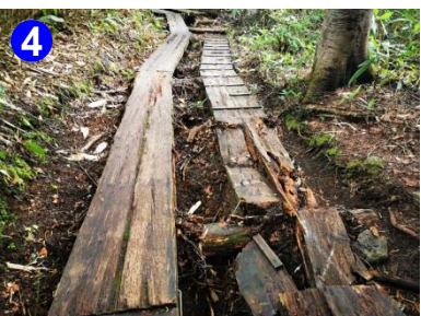
4 大清水～三平下の登山道は、木道が破損して歩きづらい箇所が多々あります。十分に注意して歩きましょう。