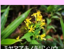
ミヤマアキノキリンソウ