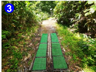
3 登山口に設置されている種子落としマットでしっかりと靴底に付いた種子を落としてから入山しましょう。