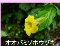
オオバミゾホウヅキ