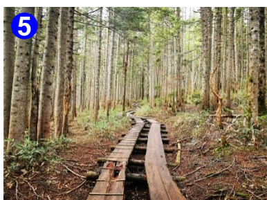
5 三平峠付近は、オオシラビソの林となっており、針葉樹の香りに癒されます。