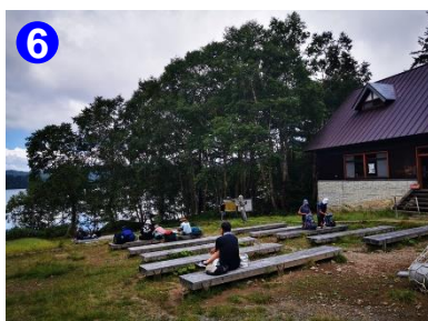
6 三平下に到着すると、開けた場所に、沢山のベンチがあり、ゆっくりと、休憩していただけます。