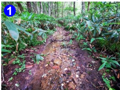
1 雨の後、登山道が沢の様になる箇所もあります。足元に気を付けて歩きましょう。