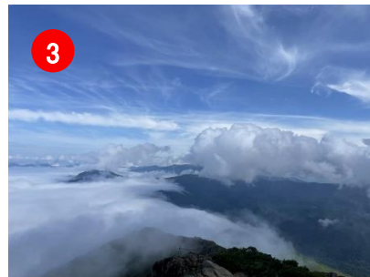
3 山頂から見る雲海がとても幻想的でした。