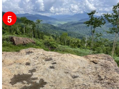
5 原見岩から尾瀬ヶ原の風景も楽しめました。