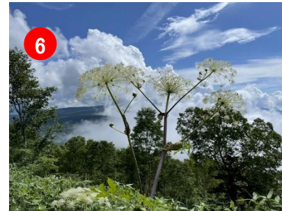
6 ミヤマシシウドが目立っていました。