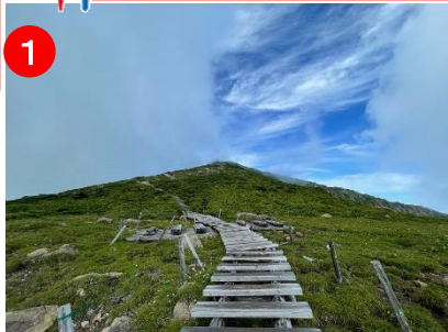
1 高天ヶ原で雲が割れ、青空が見えました。