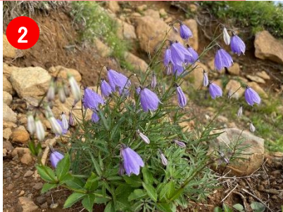
2 高天ヶ原ではたくさんの種類の花が咲いています。