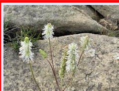
タカネトウウチソウ