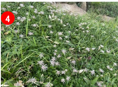
4 チングルマの果穂が朝露に濡れてきれいでした。