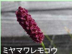
ミヤマワレモコウ