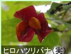
ヒロハツリバナ (実)