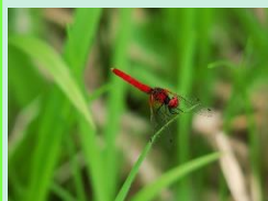
ハッチョウトンボ