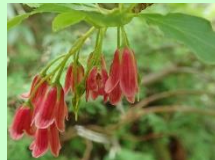
【ベニサラサドウダン】