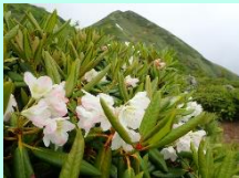
【ハクサンシャクナゲ】