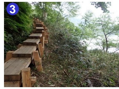
3 尾瀬沼を周回する南岸の道は比較的起伏に富んでいます。沼近くに道は設置されています。