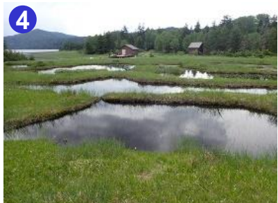
4 沼尻湿原は池塘が点在します。尾瀬沼を巡る湿原の中では、楽しみなポイントです。