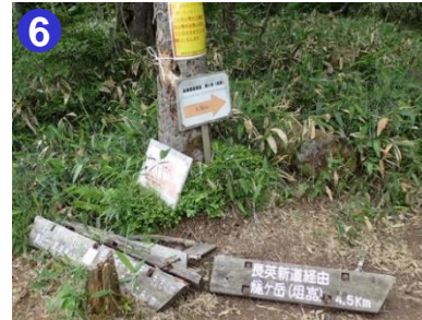
6 長英新道分岐点。本日、7月3日は「燧ヶ岳夏山開き」で、ここから山頂を目指します。