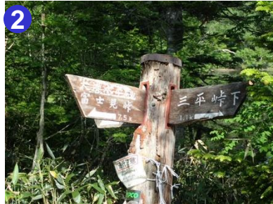
2 富士見峠分岐の道標も明瞭です。大清水水平への道はここを左折します。