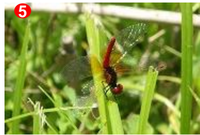
5 ハッチョウトンボは日本最小のトンボです。