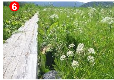
6 木道の両脇に咲いているドクゼリは、名前のとおり毒を持っています。