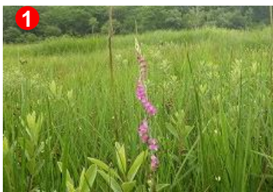
1 ネジバナが咲いています。カキツバタやコバキボウシも見られます。