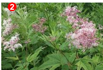
2 拋水林にあるオニシモツケ。蕾は赤みをおびています。