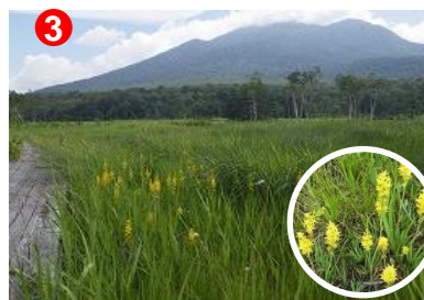
3 赤田代分岐の手前、キンコウカと燧ヶ岳。