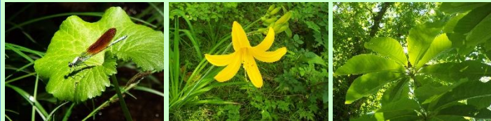
【カワトンボの仲間】 【ニッコウキスゲ】 【ホオノキ】

大清水湿原は尾瀬沼周辺よりも標高が低いため気温が高く、尾瀬沼周辺とは少し違った景色を楽しめます。また、車いすの方でも通行できるように広い木道が整備されています。山歩きに自信のない方でも、尾瀬の自然と触れ合えることができます。登山者の方もバスの待ち時間などに散策されてみてはいかがでしょうか。