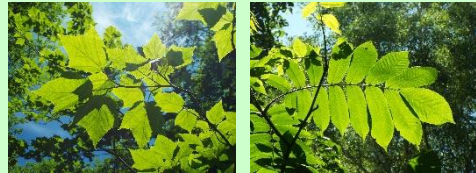
【ウリハダカエデ】 【サワグルミ】