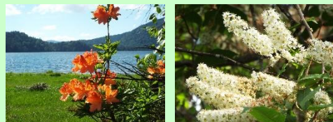
【レンゲツツジ】 【ウワミズザクラ】