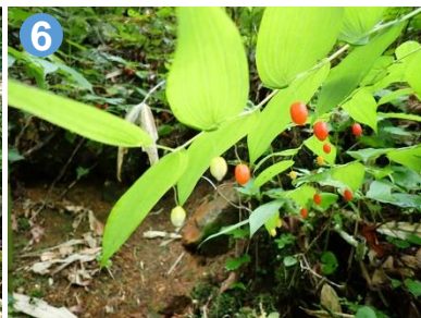
6 沢の近くでは、オオバタケシマランが結実していました。