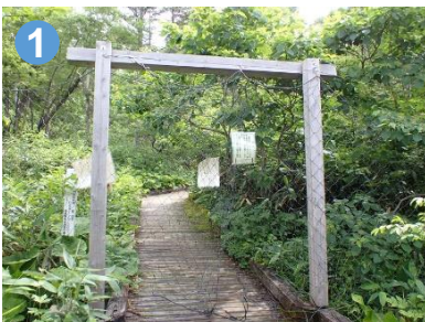
1 御池田代にはシカ対策のカーテンがあります。通過後はしっかり閉めましょう。