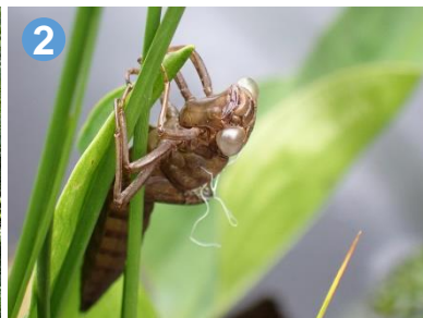
2 上田代の池塘には、羽化したばかりのヤゴの抜け殻が見られました。