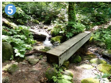
5 沢にはしっかりとした橋が架かっています。