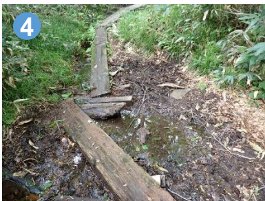
4 雨上がりにはぬかるみが多く見られますので注意しましょう。