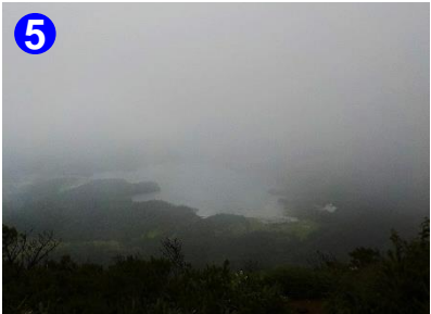
5 ミノブチ岳にて雲の合間から尾瀬沼が見えました。スペースが広く平らで休憩しやすいです。