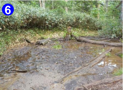
6 雨天時の長英新道ではぬかるみや水溜まりが多くあります。足元に気をつけて下さい。