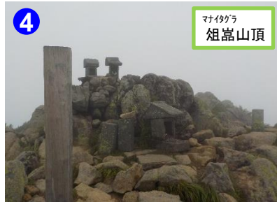
4 マイクラ 俎嶋山頂 俎嶋、柴安嶋の山頂では風を遮る物がなく強風の時は気温が下がります。防寒着などをお持ち下さい。