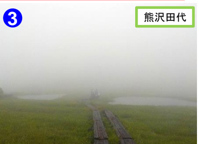
3 熊沢田代 広沢田代・熊沢田代ではキンコウカの黄色い花の群落が見られはじめてきました。見頃はまだ先です。