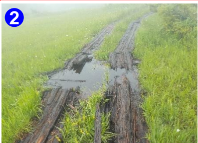
2 一部老朽化した木道があります。また、濡れている所は滑りやすいので足元にご注意ください。