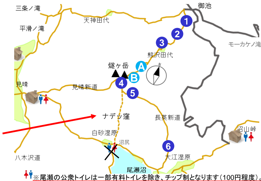
※尾瀬の公衆トイレは一部有料トイレを除き、チップ制となります(100円程度)。

【今日の尾瀬沼】 天気：雨のち曇り 最高気温：20.8℃ 最低気温：15.7℃ 日の出：4時38分 日の入：19時00分