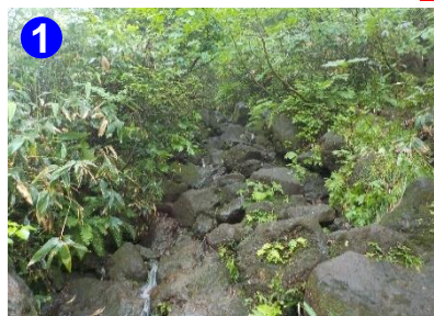
1 雨の影響で御池側の登山道の岩場が小さな沢の様になっておりました。滑りやすいので気をつけて下さい。