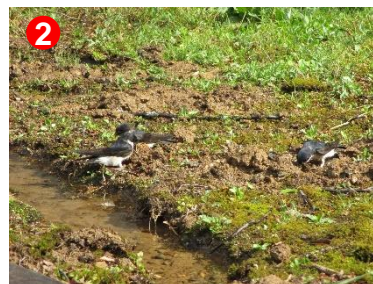
2 東電小屋にたくさんのイワツバメが巣作りしています。