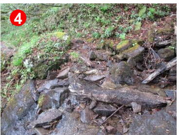
4 三条ノ滝までの山道は岩場やぬかるみが多いので注意してください。