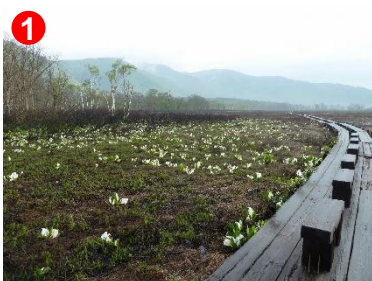
1 中田代でミズバショウの群生が見られます。