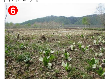
6 竜宮十字路から長沢新道に少し入ったところでミズバショウの群生が見られます。