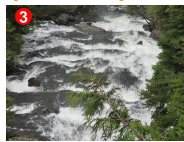
3 平滑ノ滝が見られる場所は「三条の滝まで50分」の標識が目印です。