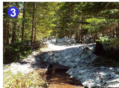
沼山峠付近の登山道は残雪あり、歩きにくくなっております。他の登山者とのすれ違いに注意しましょう。