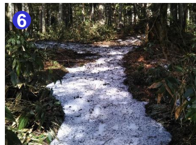
尾瀬沼キャンプ場から小淵沢田代への登山道は急な坂が続きます。休みながらゆっくり歩きましょう。