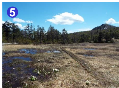
小淵沢田代ではミズバショウが少しずつ顔を出し始めています。