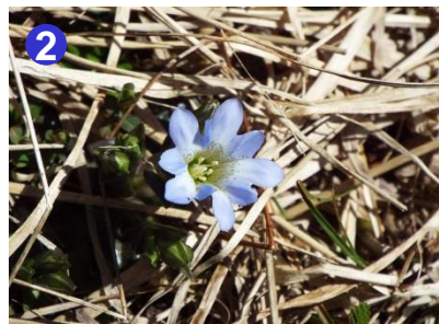
大江湿原の小淵沢田代分岐付近ではタテヤマリンドウが咲き始めていました。