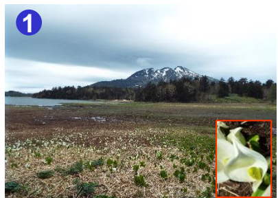
大江湿原ではミズバショウが見頃を迎えました。

沼山峠登山口から大江湿原までの登山道には残雪があります。木道の上にある雪が溶けて、一部空洞になり、踏み抜きに注意が必要な箇所があります。また濡れている木道は大変滑りやすいので足元にご注意ください