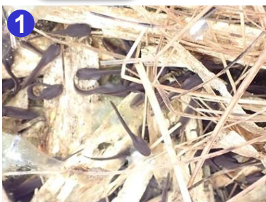
1 早稲の砂風近くの水場で、体長5mmほどのオタマジャクシが、たくさん泳いでいました。