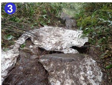
3 尾瀬沼を一周する道では、南岸の一部のみ最後の雪が残っています。