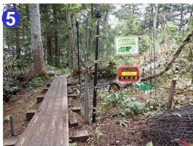
5 間もなく鹿の侵入防止のための柵が設置されます。設置後は足下に注意し通行してください。