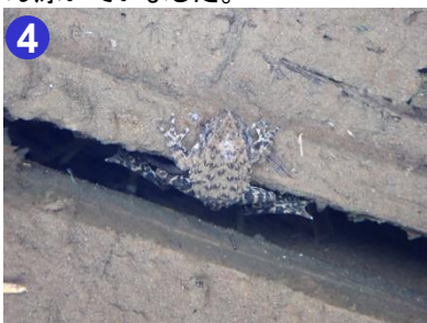
4 木道の下を見ると、ツチガエルが水の中から覗いていました。