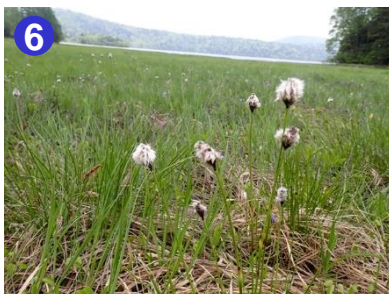
6 大江湿原ではワタスゲが、花から果穂(綿毛)になりつつあります。