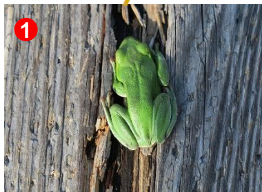
1 雪解けが進み、冬眠から目覚めたモリアオガエル。