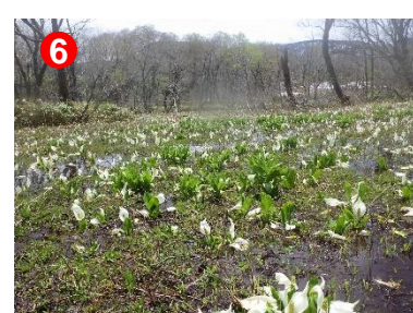
6 東電尾瀬橋付近のミズバショウの群生。