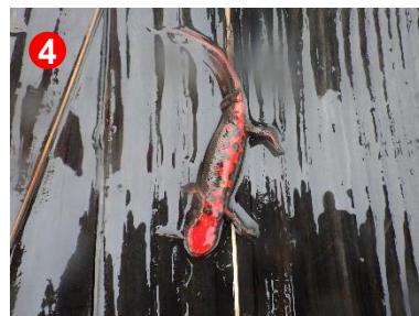
4 濡れた木道に出てきたアカハライモリ。