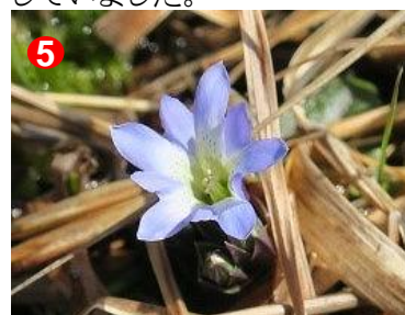
5 まだ少しですが、タテヤマリンドウが咲き始めました。