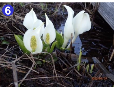
6 見晴から東電分岐間ではミズバショウが咲き誇っています。

【今日の尾瀬沼】 天気：晴れ 最高気温：19.8℃ 最低気温：7.4℃ 日の出：4時28分 日の入：18時55分