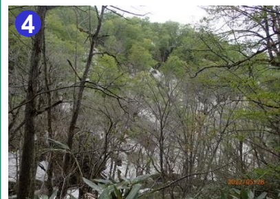
4 イヨドマリ沢は、付近の新緑が優美です。