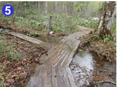
5 見晴新道からの雨水や雪解け水が流れ込み、木道の冠水があります。