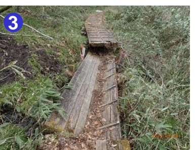
3 残雪はほほ消えています。木道の損壊部分の通行は注意が必要です。