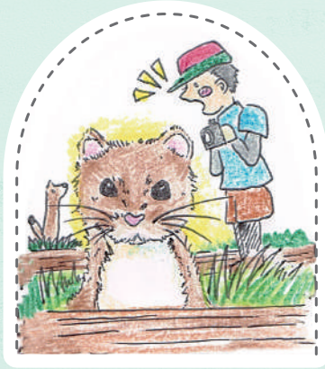
うれしかったこと 感動したこと