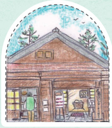
ビジターセンター