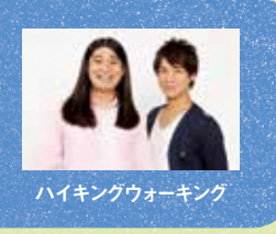
ハイキングウォーキング